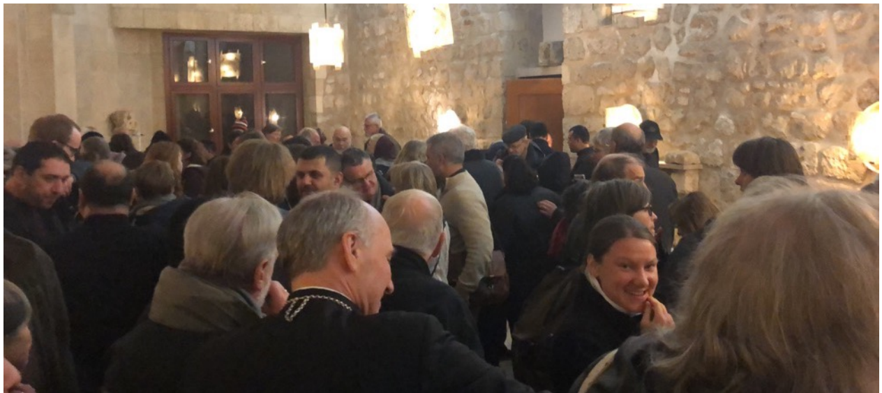
Collation après la célébration dans les locaux du Muristan. Église luthérienne.

La naissance de Jésus est le but de l'histoire du salut, qui contredit toute ethnicisme, racisme et misogynie. Dans la généalogie des femmes étrangères sont incluses, comme Tamar, Ruth, Bethsabée et des rois pécheurs en font aussi partie !