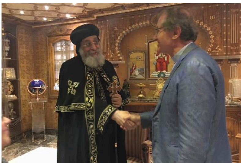
Avec le pape Tawadros, patriarche de l'Église orthodoxe copte

Grâce à la collaboration du mouvement des Focolari en Egypte nous avons été reçu par les principaux responsables des Eglises orthodoxe, catholique, protestante et évangélique. Nous avons aussi visité plusieurs communautés, mouvements et monastères.