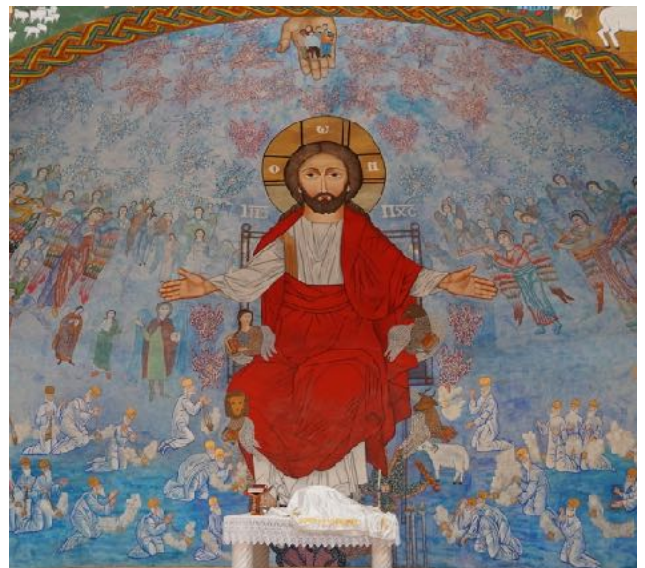
Le Christ ressuscité. Fresque du Centre Anafora, Egypte