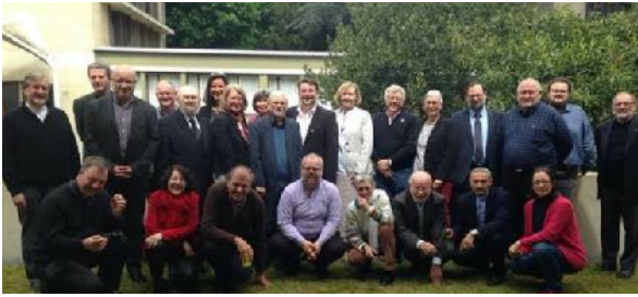
Rencontre de bilan du Forum francophone

Après ma participation au « Forum chrétien francophone » (Lyon, octobre 2018), j'ai été invité à participé à un groupe de travail pour préparer un tel Forum en Suisse romande, prévu en automne 2021. Ce Forum est un lieu privilégié de rencontres entre membres de différentes Églises.